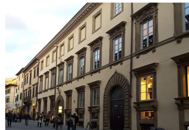
“Palazzo vista Corso Italia”

Il Palazzo Guillichini è un complesso immobiliare di pregio dove sono state eseguite opere di restauro sulla facciata e appartenente ai Conti della Gherardesca e in parte di nostra proprietà posto nel centro di Arezzo, in Corso Italia, “Ex Cinema Corso” composto da locali destinati ad attività commerciali e residenziali.