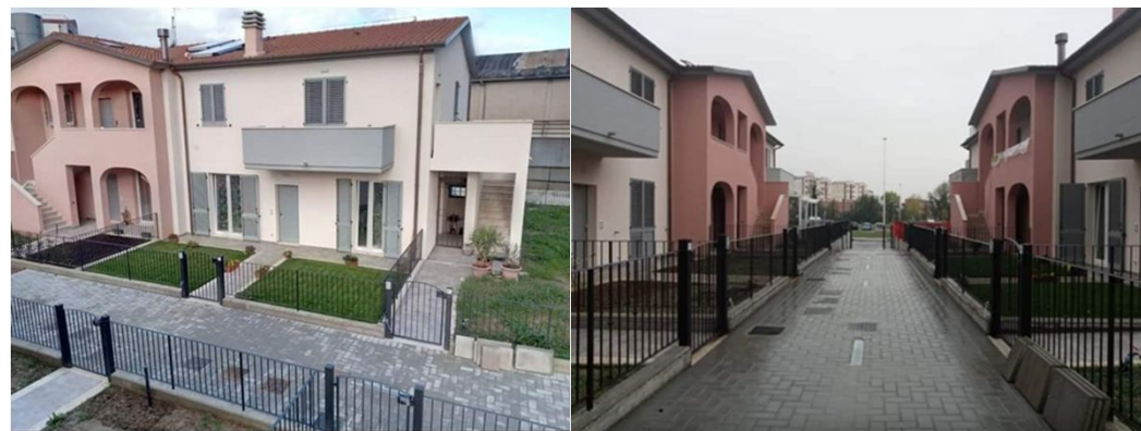
"Vista delle due palazzine ultimate"

Contesto Residenziale Via Carlo Pisacane Arezzo